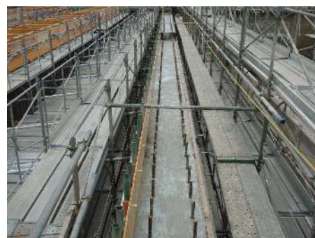
硬化後～14日以内にコンクリート打設