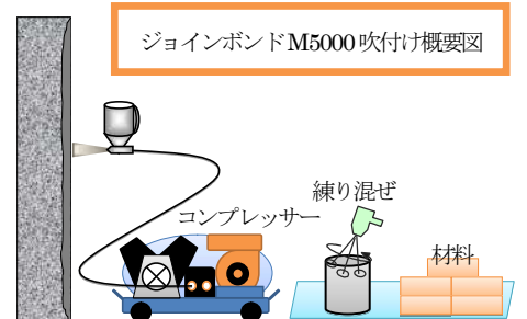
ジョインボンド M5000 吹付け概要図